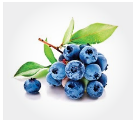
Arandano bolsa de 1kg