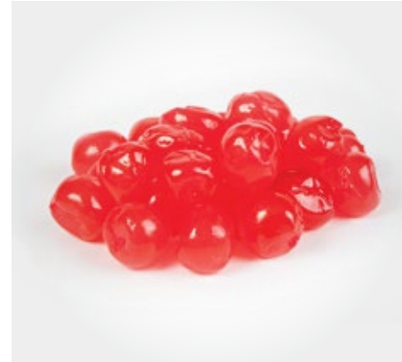
Preparado Richs Sachet 1kg (anana/frutilla/maracuya/choco)