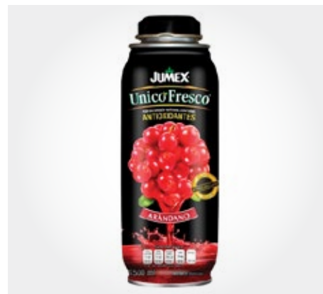
Jumex arándano Tetrapack 473ml