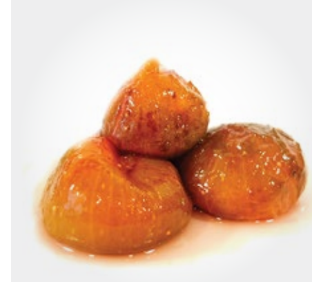
Higos en almibar Presentacion: 3 kg