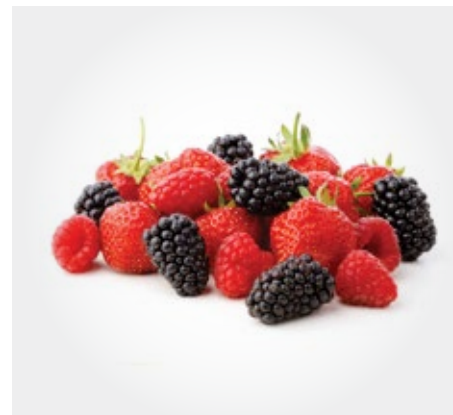
Mix frutos rojos bolsa de 2kg