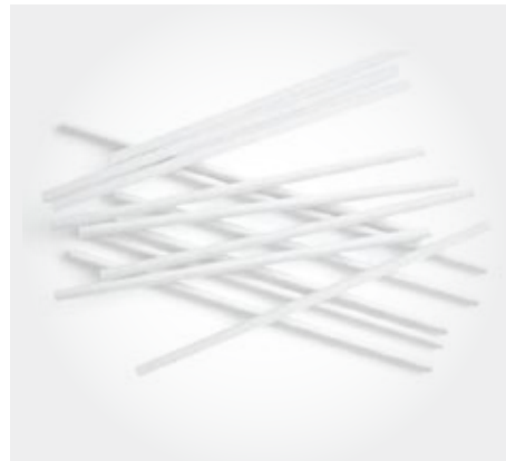
Sorbetes de polipapel

Todo lo necesario para una prolija presentacion durante e servicio