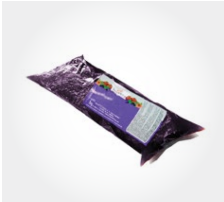
Preparado Richs Sachet 1kg (anana/frutilla/maracuya/choco)