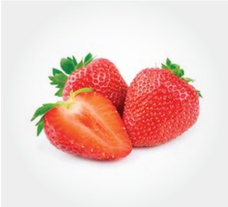
Frutilla (pulpa concentrada) Presentacion: 6 kg