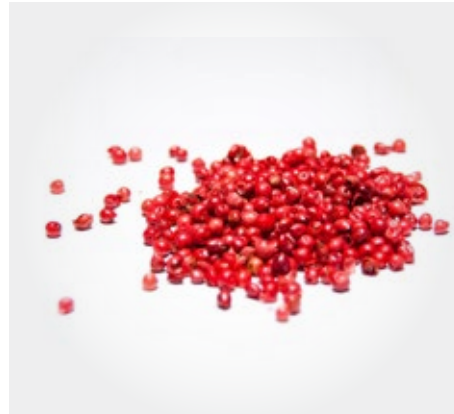
Pimienta rosa Presentación: 1 Kg