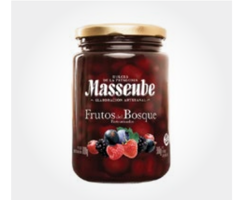
Mermeladas Masseube Frascos de 212gr y 900gr (arándanos, sauco, calafate cereza negra , f. rojos, guinda,