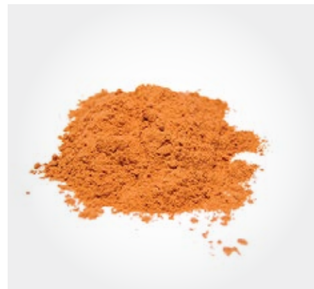
Canela en polvo Presentacion: 1 Kg