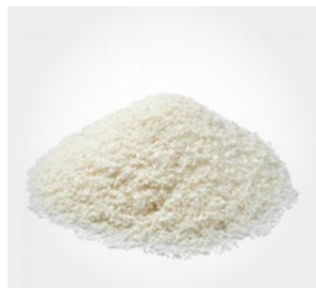
Coco Rallado Presentacion: 1 Kg