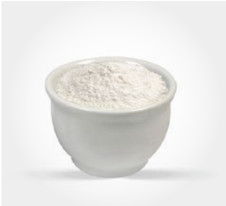
Azúcar impalpable Presentación: 800gr

Suplementos para el servicio de cafetería in situ o take away