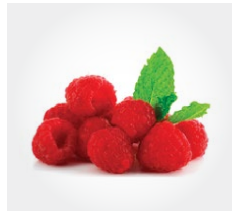
Frambuesa bolsa de 1kg