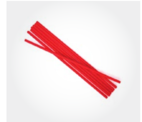
Sorbete papel bio (rojo)