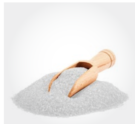
Azucar Refinada Presentacion: 1 Kg