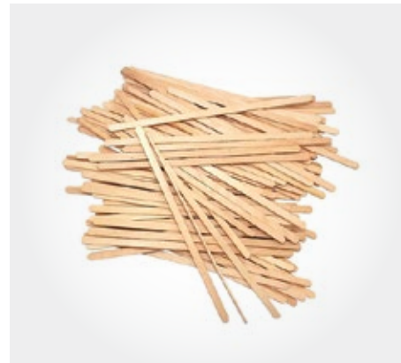
Agitadores de madera