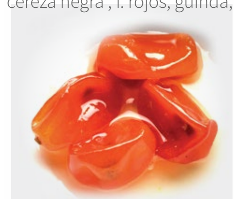
Kinotos en almibar Presentacion: 3 kg