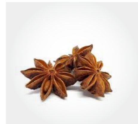
Anis estrellado Presentacion: 1 Kg