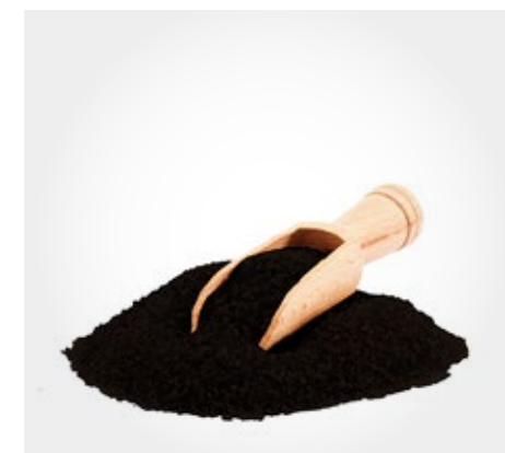
Azucar negra Presentacion: 1 Kg