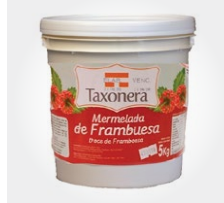
Mermelada Taxonera Balde de 5 kg (arandano/naranja)