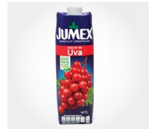
Jumex Uva Tetrapack 1L