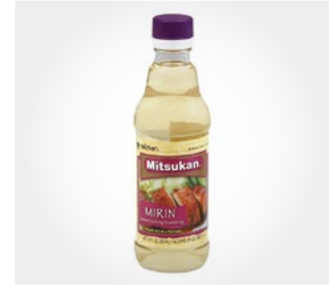
Mirin Mitsukan Por unidad