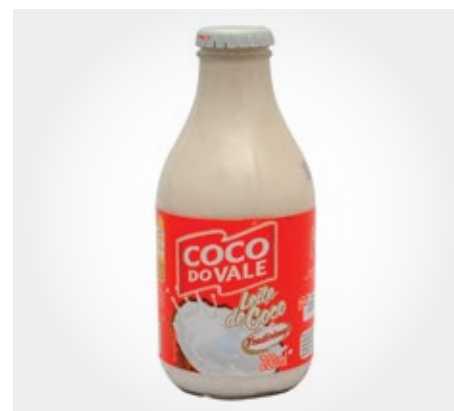
Leche de coco Tetrapack 200ml