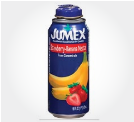
Jumex banana y frutilla Tetrapack 473ml

Suplementos para el servicio de cafetería in situ o take away