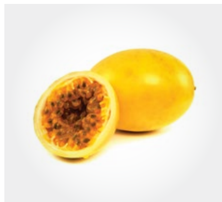
Maracuya bolsa de 5kg (Con o sin semillas)

Frutas congeladas y preparados para sabores intensos