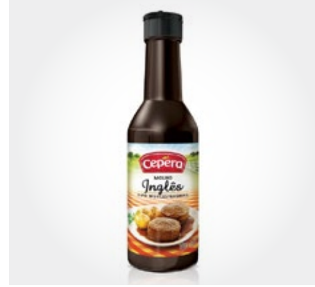
Salsa Inglesa Cepera Por unidad