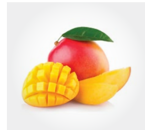
Mango bolsa de 1kg (pulpa o cubeteado)