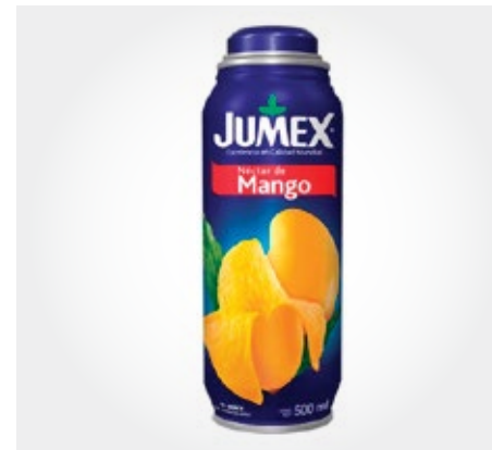
Jumex Durazno Tetrapack 473ml