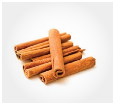
Canela en rama Presentacion: 1 Kg

Suplementos para el servicio de cafetería in situ o take away