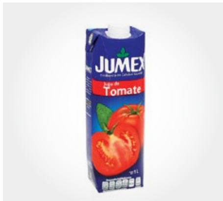
Jumex Tomate Tetrapack 1L