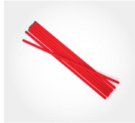
Sorbete papel bio (rojo)